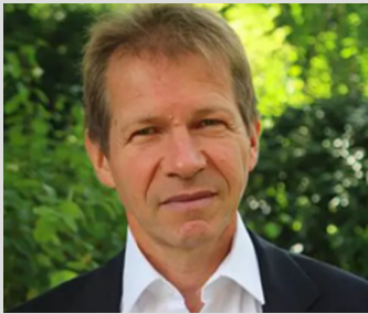
J.M Jancovici Président du Think Tank Shift Project

Surfez léger sur le Web en évitant les réseaux sociaux porteurs de haine et de Fake news. Baissez votre chauffage. Si vous avez froid portez un pull supplémentaire, à col roulé de préférence, comme le préconise notre ministre des Finances Bruno Le Maire. N'achetez plus de vêtements neufs, privilégiez les vêtements usagés que vous trouverez dans des bourses spécialisées. Réduisez l'usage des produits jetables et le nombre de lavages de vos jeans. Mangez moins de plats pré cuisinés et de protéines animales, les vaches relâchent du méthane en pétant. Limitez à 4 vos déplacements aériens durant votre vie. Et si vous devez mourir jeune, tant pis pour les vols perdus ! Ce sera toujours ça de gagné pour la planète. En cherchant bien vous devriez trouver d'autres moyens de réduire encore votre « carbonation » même si vous pensez que l'on se rapproche de plus en plus du mythe du bon sauvage décrit par Jean-Jacques Rousseau. Mais dites-moi, sans rire, toutes ces restrictions écologiques parfois ubuesques n'êtes-vous pas, comme moi, en train de les appliquer plus ou moins grâce à... l'inflation ? ☐ Inflation, décarbonation, récession même combat pour lutter contre la consommation !