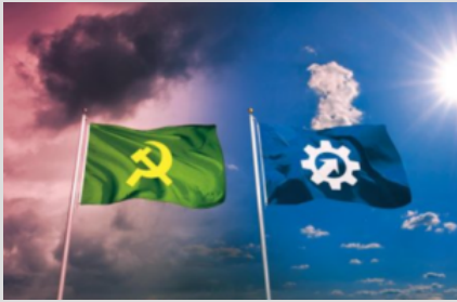
Les Khmers verts vus par les Suisses

« D'argent et de sang » s'en est inspirée, ce qui peut aussi expliquer la méfiance de certains de nos compatriotes qui ont un peu de mémoire.